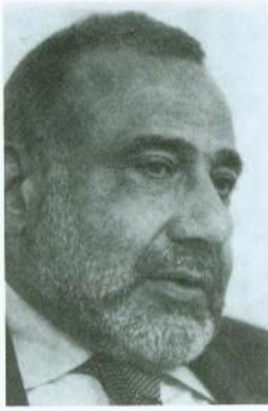
الدكتور عادل مهدي، العضو القيادي في المجلس الأعلى للتورة الإسلامية في العراق والعضو المساعد البارز في مجلس الحكم